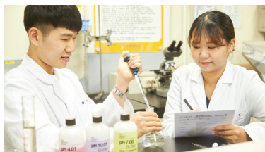
식품위생학, 식품분석 및 식품위생법규