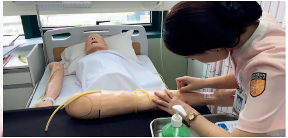
핵심 역량 실습