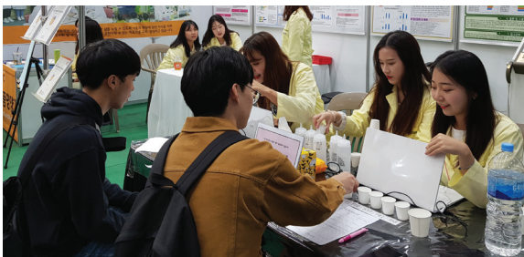
부천대학교 EXPO 및 졸업논문 발표전