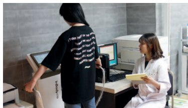
영양교육, 식사요법 및 생리학