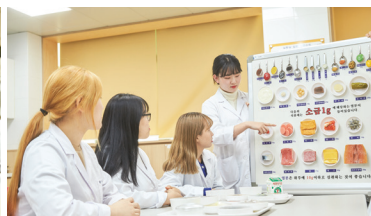
영양학, 생화학 및 식품학